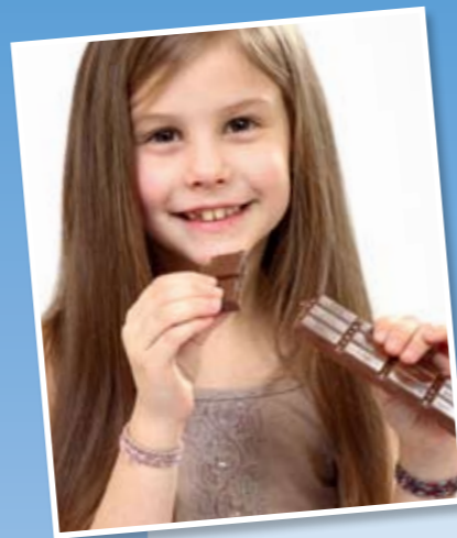
Uważaj na wszystkie łakocie: w nich może kryć się gluten!

Jak już wiesz, gluten to taki zły stworek, który sprawia, że nie czujesz się dobrze. Ale to nie jest tak, jak przy bólu gardła lub katarze. Gluten to białko, które znajduje się w niektórych gatunkach zbóż. Działa jak klej, który powoduje, że zboże zmielone na mąkę (po zmieszaniu z wodą) ma właściwości klejące - możesz to łatwo zapamiętać. Możesz sobie wyobrazić, że to klej, podobny do tego, którego używasz do klejenia papieru lub modeli. Gluten ma jednak jeszcze jedną przydatną cechę: sprawia, że ciasto na chleb i pizzę jest bardzo elastyczne. Nic więc dziwnego, że gluten znajduje się w tak wielu produktach żywnościowych.