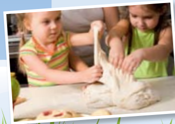
Gluten powoduje, że ciasto się nie rozlatuje i jest bardzo elastyczne.